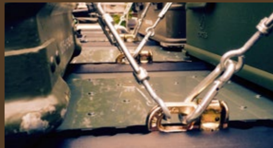
Individuell anzuordnende Verzurrpunkte