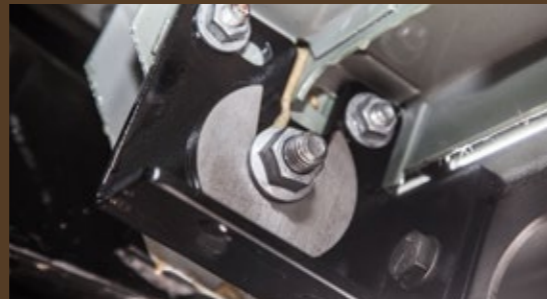
Einfache Montage ohne zu bohren