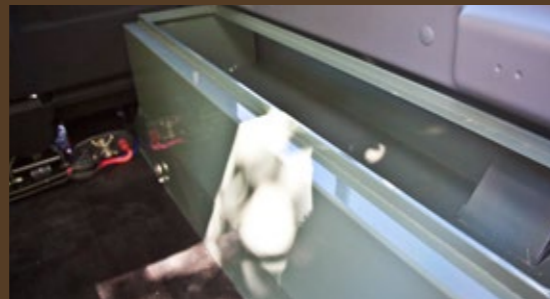
Systembox in Skelettbauweise