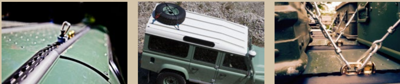
Dachträger (Seite 10 bis 11)