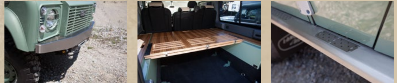
Sonderedition Defender „Heritage“ (Seite 12 bis 13)