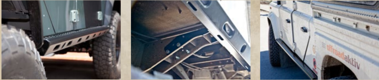
Rockslider (Seite 6 bis 7)