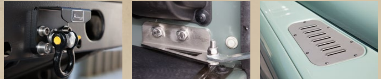
Anbauteile (Seite 14 bis 15)