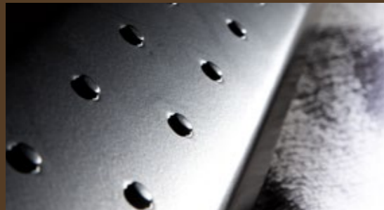
Gezogene Noppen für rutschfesten, sicheren Stand

Für alle Land Rover Defender (90, 110, 130), Material Edelstahl, schwarz gepulvert