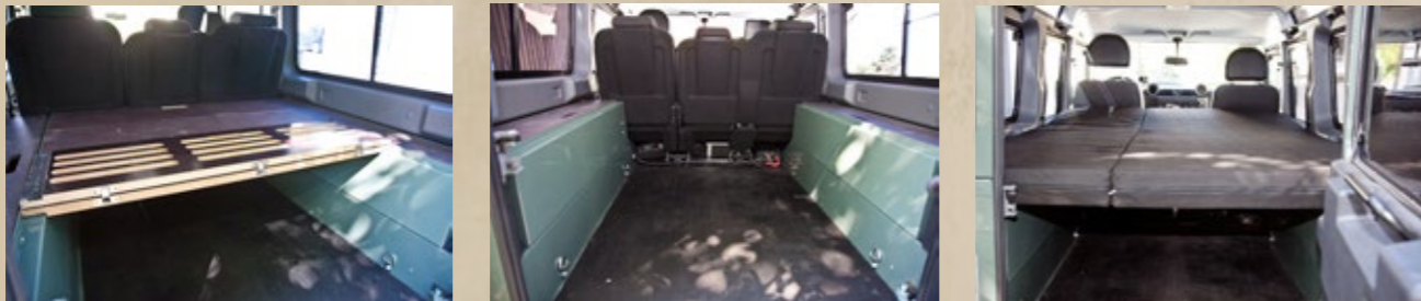
Multifunktions- und Schlafausbau (Seite 8 bis 9)